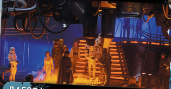
КАМЕРА ЗАМОРОЗКИ В КАРБОНИТЕ