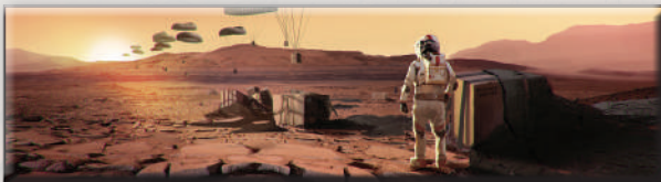
«Поставка снабжения» (Гарретт Каида)

Этот вариант игры можно использовать с любыми дополнениями. Теперь, вместо того, чтобы увеличивать глобальные параметры, ваша цель — повысить свой РТ до 63 за 14 поколений (или за 12, если вы играете с картами прологов). Пометьте 63-е деление золотым кубиком. В этом варианте игры добавляется новый стандартный проект «Буферный газ», который стоит 16 М€ и повышает ваш РТ на 1. В остальном действуют обычные правила игры в одиночку.