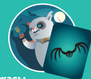
Ужасы — Летучая мышь