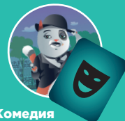
Комедия — Маски