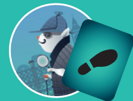
Детектив — Следы