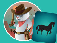
Вестерн — Лошадь