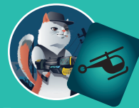
Боевик — Вертолёт

Чтобы стать победителем, недостаточно просто быстро кидать карты. Выиграет тот игрок, который правильно подберёт аксессуары к жанрам кино. Как написано здесь: