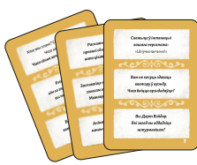
25 карт Вопросов