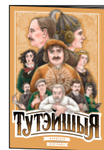
Брошюра с биографиями