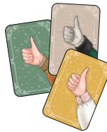
6 карт Лайков