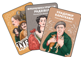
50 карт Персонажей