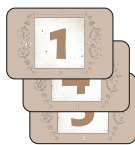
12 карт Выбора