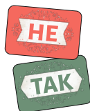
6 карт Да/Нет